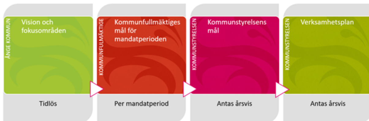
Figur som visualiserar hur visionen bryts ner hela vägen till en verksamhetsplan.

Utöver dessa politiskt antagna aktiviteter ska varje enhet självständigt bryta ner de politiska målen i egna aktiviteter. Antalet mål som varje enhet ska arbeta med styrs av enhetens förutsättningar. De politiska mål som enheterna själva valt att arbeta med redovisas inte automatiskt vid tertialrapporteringarna, utan redovisas till kommunstyrelsen eller dess utskott på begäran via uppsiktsplanen.